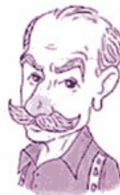
نادر ابراهیمی (۱۳۱۵-۱۳۷۸ ه.ش)