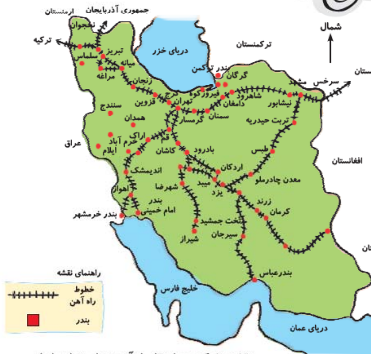
نقشه‌ی شبکه‌ی حمل و نقل راه آهن و بندر تجاری ایران

در درس قبل با راه‌ها و وسایل حمل و نقل آشنا شدیم.