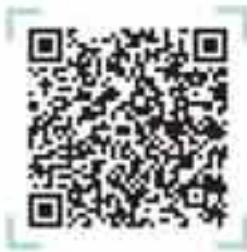
رشته‌های دانشگاهی ریاضی و فیزیک

در این بخش اطلاعاتی کلی و اجمالی در مورد انتخاب رشته به شما خواهیم داد که شامل چند قسمت است و حتی می‌توانید برای تکمیل اطلاعات و اشراف بیشتر به سایت مهروماه مراجعه کنید.