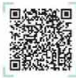
رشته‌های دانشگاهی علوم تجربی