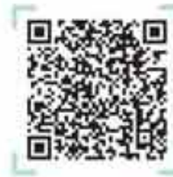
رشته‌های دانشگاهی علوم انسانی